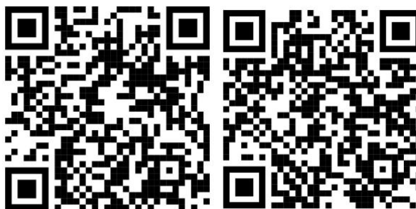
QR kódy pre video návod